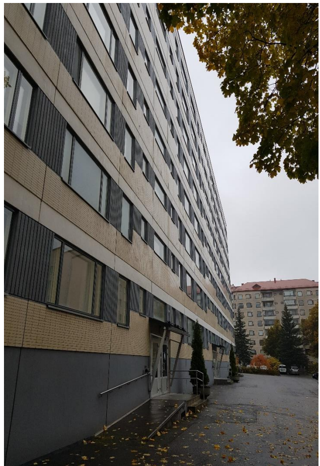
Kuva 2 ja 3 kuvia julkisivusta.