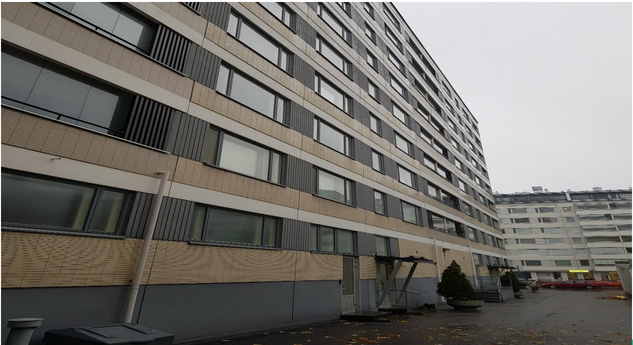
Kuva 1 Kuva julkisivusta.

Huoneistojen ikkunoissa on korvausilmaräppänät ja näitä kautta tupakansavulla on pääsy myös huoneistoihin.